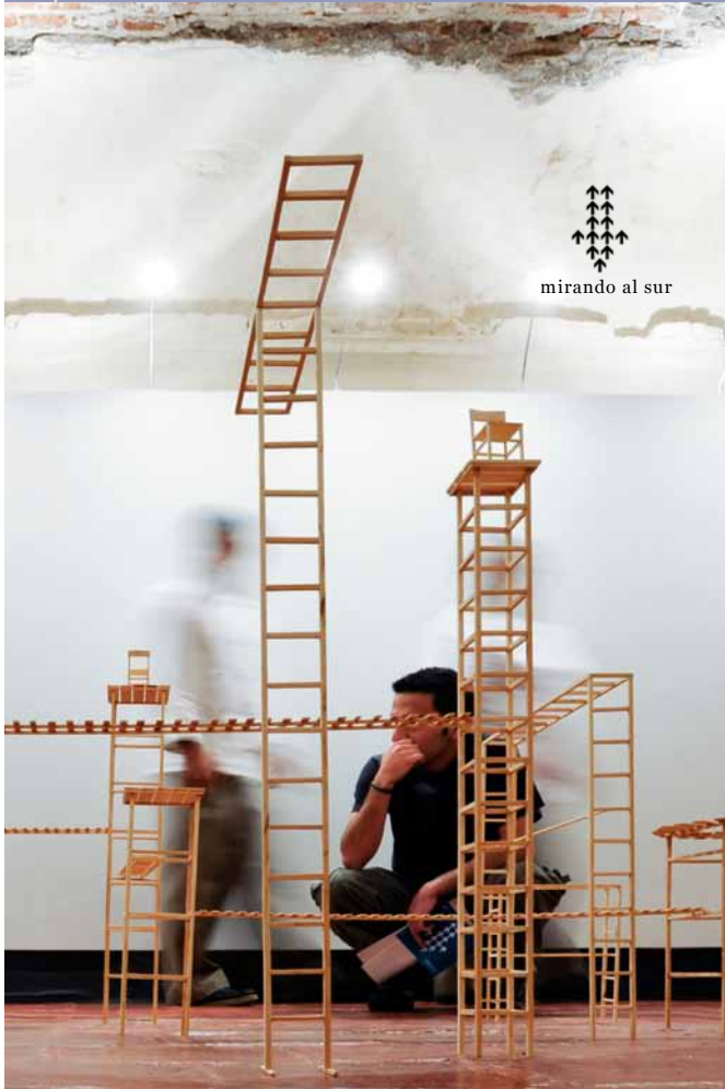
mirando al sur